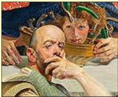
Jacek Malczewski, Autoportret z Erynią

W porównaniu - w 2007 roku najdroższym obrazem sprzedanym przez Agrę był "Powrót z Jarmarku" Wierusza-Kowalskiego za 580 tyś. zł. W ostatnim półroczu, jak widać z zestawienia wyprzedziły go cenowo już 4 obiekty.